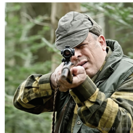
„Waldesruh“, 2012, Regie: Marc André Misman