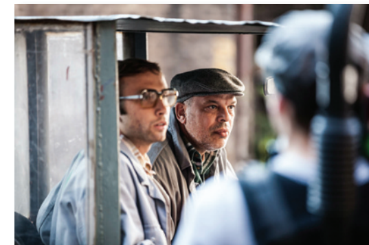
„Rauchzeichen“, 2012 Regie: Gabriel Borgetto