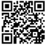
Filme Wolfgang Reeb